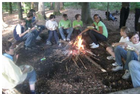
Essen am Lagerfeuer.